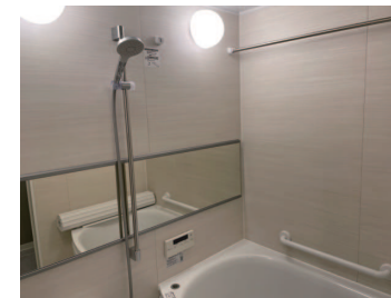
写真は施工例です。