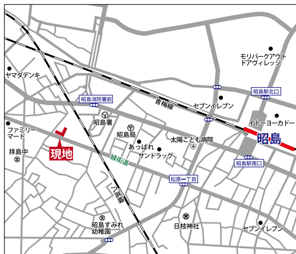
ライフインフォメーション