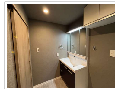
※内装写真は施工例です。