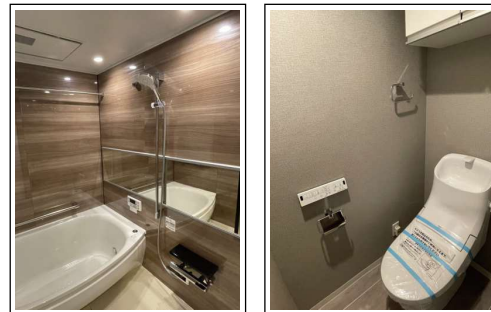
※内装写真は施工例です。