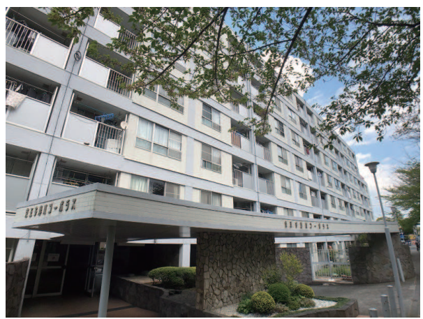
京王多摩川コーポラス外観