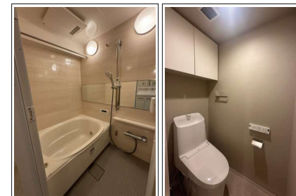
※室内写真は当社施工例